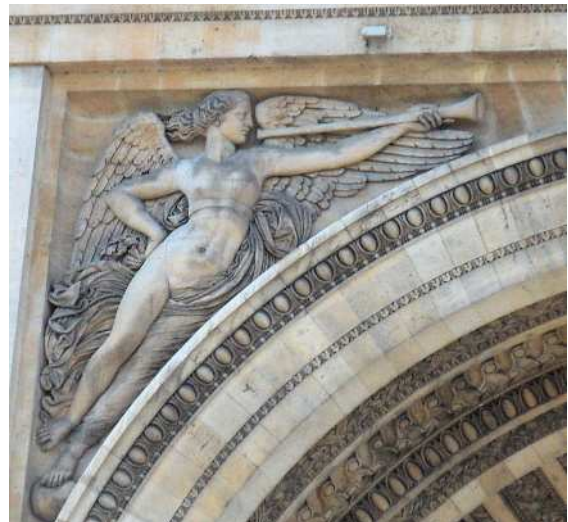
Une des Renommées de l'arc de triomphe.

Par contre, les Renommées de l'arc de triomphe constituent la première grande réalisation monumentale, formée de quatre bas-reliefs en pierre de 6m de hauteur sur 6m de largeur, décorant les écoinçons de l'arcade centrale, côté Paris et côté Neuilly. Commandées en mars 1829, leur gestation dure quatre ans et l'inauguration n'a lieu qu'en juillet 1836. C'est un décor, sur le modèle antique, de figures allégoriques, d'une grande finesse.