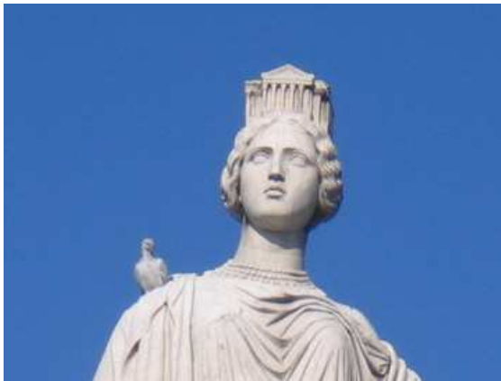
La tête de la « Ville de Nîmes ». Fontaine Pradier, Nîmes.

Justice, nouvellement construit dans le style néoclassique.