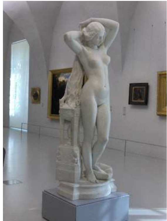
La toilette de Nyssia , musée Fabre, Montpellier.

Exposée au Salon de 1846, elle provoque une réaction très élogieuse mais aussi des critiques violentes.