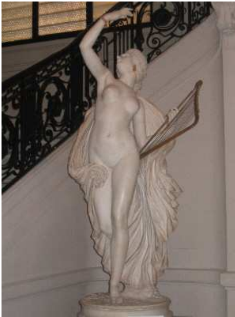
La Poésie légère , musée de Nîmes.

cheveux, dans l'inclinaison de la tête et la disposition des bras. Elle prend l'aspect d'une femme pudique, le bras replié sur la poitrine et, en même temps elle témoigne d'un certain érotisme donné par la chute du drapé sur les hanches.