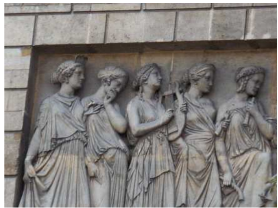
L'Instruction publique : les muses, Façade du Palais Bourbon,

C'est un bas-relief didactique simple, accessible à tous et aussi d'une grande liberté, malgré son apparence antique. L'introduction de la référence moderne du costume d'un personnage, les gestes et les attitudes rendent la scène réaliste et parlante. Du point de vue stylistique, on l'a comparé à la procession des Panathénées de Phidias.