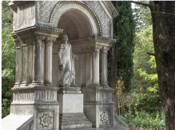
Le Tombeau Amenlier, Nîmes.

Sur les deux contreforts bordant les extrémités de la façade se dressent les statues de saint Charles-Borromée et sainte Thérèse, qui étaient les patrons des époux Farnous ; ces statues non signées ne peuvent, dans l'état actuel des recherches, être attribuées avec certitude à Pradier.