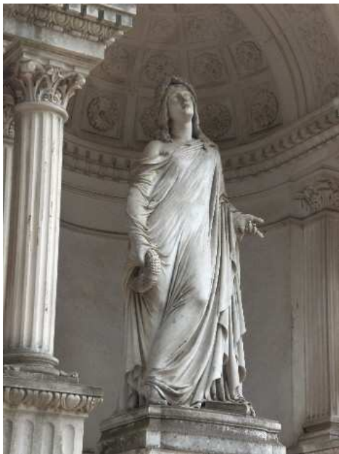
L'Immortalité de l'âme, Nîmes.