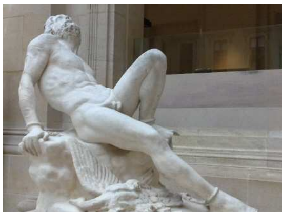
Prométhée , musée du Louvre.

La statue de Prométhée en marbre de Carrare, est commencée à Rome en 1823, terminée à Paris en 1827 et placée aux Tuileries en 1832. Puni par Zeus pour avoir dérobé le feu aux dieux et l'avoir donné aux hommes, Prométhée fut enchaîné au sommet du mont Caucase et son foie qui repoussait constamment, était dévoré par un aigle qui sera tué par Héraclès. Le sculpteur donne une image nouvelle du héros antique, prisonnier de ses chaînes, mais libéré du vautour qui gît à ses pieds. Cette interprétation très romantique est appréciée par la critique. Certains y voient le présage de la révolution qui aura lieu trois ans après.