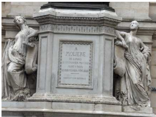
Les figures allégoriques de la fontaine dédiée à Molière, rue de Richelieu, Paris.

Ces muses donnent tout son éclat à cette fontaine jugée par ailleurs assez banale. Pourtant, elle fait l'objet d'une inauguration particulièrement solennelle car c'était là le premier monument public parisien dédié à un homme de l'art.