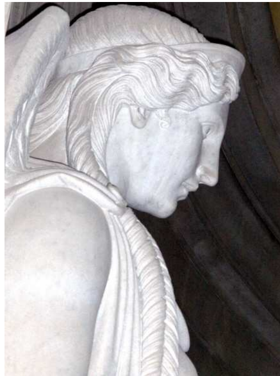
Détail d'une victoire, crypte du tombeau de Napoléon aux Invalides.

À propos des difficultés rencontrées, Pradier aurait eu ces paroles prémonitoires : « le tombeau de l'Empereur sera le mien. »