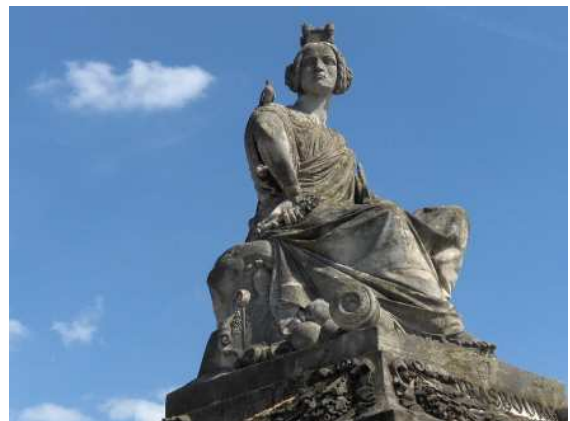
Strasbourg, place de la Concorde

Personnifications des villes, ces femmes assises et portant des couronnes murales se rencontraient dans la sculpture depuis l'Antiquité.