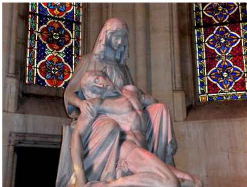
La Pietà de la chapelle de La Garde.