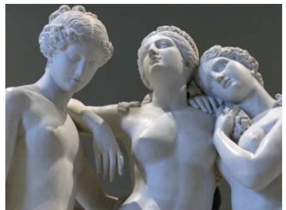
Les Trois Grâces, musée du Louvre.

Au pasteur genevois, Gaberel, de passage à Paris en 1838, Pradier, se plaignant du mauvais goût ambiant, aurait dit : « [...] J'eus de mauvais jours après 1830...les arts étaient envahis par le laid, le grotesque, le tordu ; [...] et l'antique, la perfection de la beauté humaine, c'était du rococo [...] on comprendra que le seul avenir possible pour la sculpture, ce sont les formes anciennes rajeunies par des expressions, une vie nouvelle. » 15 . Ce jugement est une clé permettant de comprendre l'évolution de ce type de production.