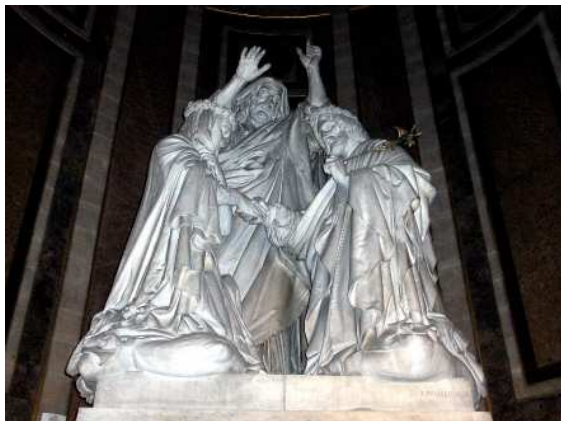
Le mariage de la Vierge Eglise de la Madeleine, Paris.

Ils reçoivent la bénédiction du grand prêtre à la physionomie très expressive, pour lequel Pradier s'est montré attentif à l'exactitude du costume et des insignes. On retrouvera ce souci de vérité historique dans la Pietà de la chapelle de la Pauline.