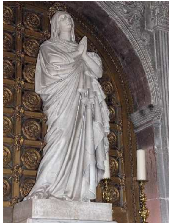
Notre-Dame-des-Dons , 1848.

La statue de la Vierge de Notre-Dame-des-Doms à Avignon, datée de 1838, est le premier ouvrage religieux, exécuté pour le Midi.