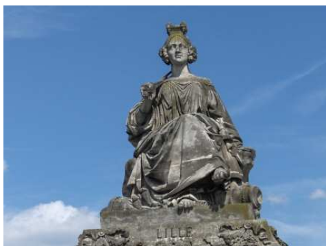
Lille, place de la Concorde.

Leurs physionomies et leurs coiffures modernes correspondent aux modèles observés à l'atelier, ce qui constitue pour beaucoup une choquante entorse aux conventions de la sculpture allégorique devant idéaliser costume et expression physiognomique.