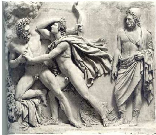
Néoptolème empêche Philoctète de percer Ulysse de ses flèches, relief en plâtre, H. 121cm, L. 150 cm, prof. 20 cm, Genève.

l'Académie, notamment la référence à une œuvre antique et l'idéalisation. Pradier devient pensionnaire de la Villa Médicis jusqu'en 1818.