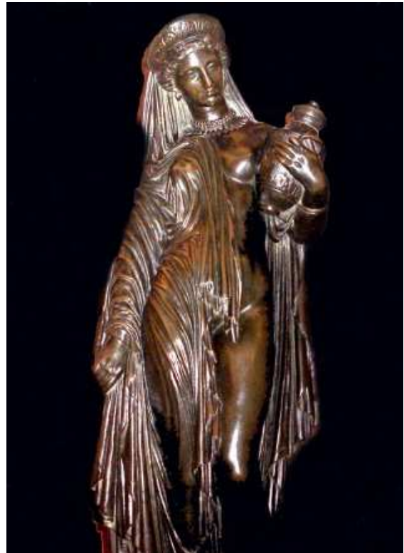
Pandore , musée de Nîmes.

On trouve de nombreuses Pandore : une en marbre « grandeur nature » en Belgique, et deux de format « demi-nature » en bronze, une à Genève et l'autre à Nîmes, objet d'une récente exposition ; il existe aussi de nombreuses réductions en bronze ou autres matières.