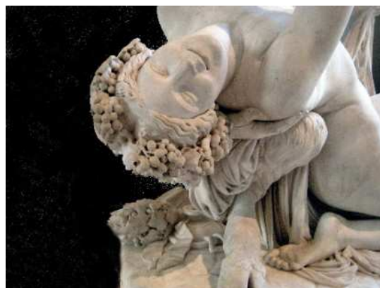
Satyre et bacchante (détail), Musée du Louvre

C'est Flaubert qui avait raison : sa seule préoccupation, c'était l'amour de l'Art qui lui permit d'atteindre ce qui est l'essence même de l'Art, la Beauté.