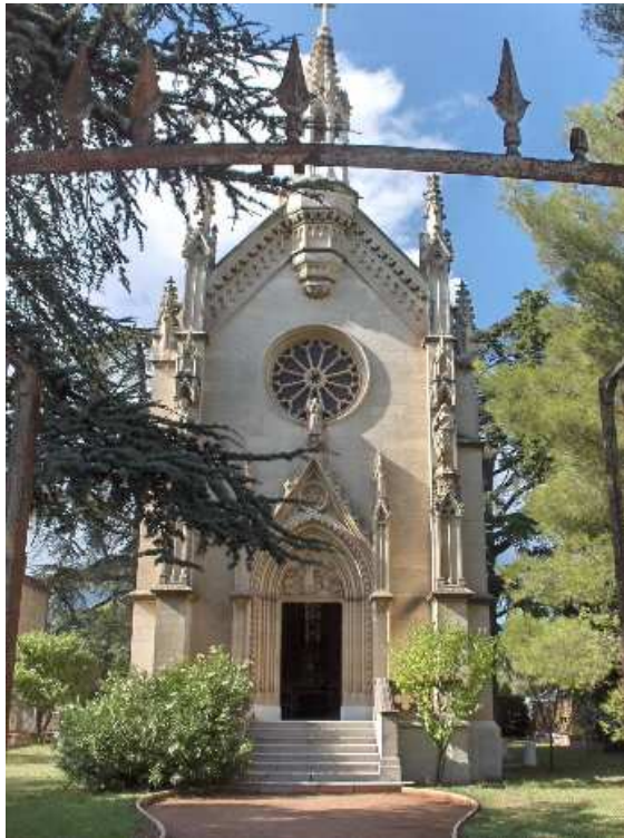
Chapelle Saint-Charles-Borromée, La Garde.

Le groupe est acquis en 1850 par une habitante de la Farlède, veuve du fils d'un notaire valettois, Charles Farnous, qui s'était enrichi « au-delà des mers » 12 . Cette œuvre est placée sur le tabernacle de l'autel de la chapelle érigée entre 1850-1852, à la mémoire de son mari par l'architecte lyonnais Fontaine dans le quartier de La Pauline.