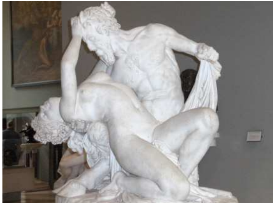
Satyre et bacchante , musée du Louvre.

Beauté, Aglaé, Thalie et Euphrosyne ; la nudité des corps ; enfin, le jeu des attitudes nécessaires à l'intelligence de l'action de ces personnages vivant dans l'Harmonie. L'apparence est bien « grecque », comme l'exige l'époque. Mais par le réalisme des figures, Pradier innove, ce que les critiques de l'époque ont bien senti. Pour eux, il est question de « respect scrupuleux de la vérité de la forme », de « chaleur d'exécution » et même de « Grâces jolies et désirables » 16 .