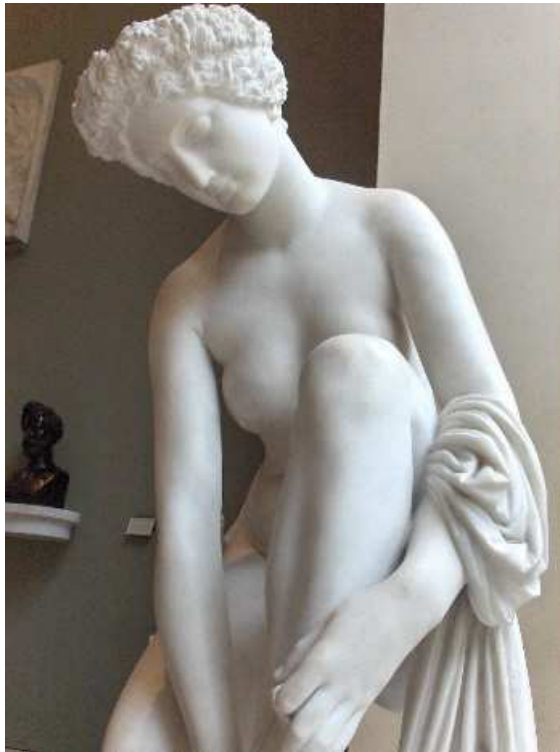
La Toilette d'Atalante , musée du Louvre, Paris.

Avec La Toilette d'Atalante , œuvre de 1849 que l'on trouve au Louvre, Pradier aborde un thème tiré des Métamorphoses d'Ovide, cher aux sculpteurs baroques. Toujours victorieuse dans les courses, Atalante avait promis, face à ses nombreux prétendants écartés, de s'offrir à celui qui la dépasserait. Un stratagème de Vénus permit à Hippomène de la conquérir, en lançant au-devant d'elle trois pommes d'or qu'Atalante ramassa, retardant sa course.