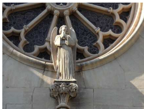
Chapelle de La Garde, L'Ange de la Résurrection.

Le tympan du portail de l'église est orné d'un relief qui représente Saint Charles-Borromée soignant les pestiférés de Milan , signé par Pradier, à droite sous la poitrine de la femme agonisante. Le choix du sujet, correspondant à une des dernières œuvres de Puget, ne me semble pas innocent de la part de Pradier qui se réclamait souvent de Puget. Le travail a certainement dû être terminé par ses aides car l'œuvre n'a pas la vigueur de ce que fait Pradier habituellement.