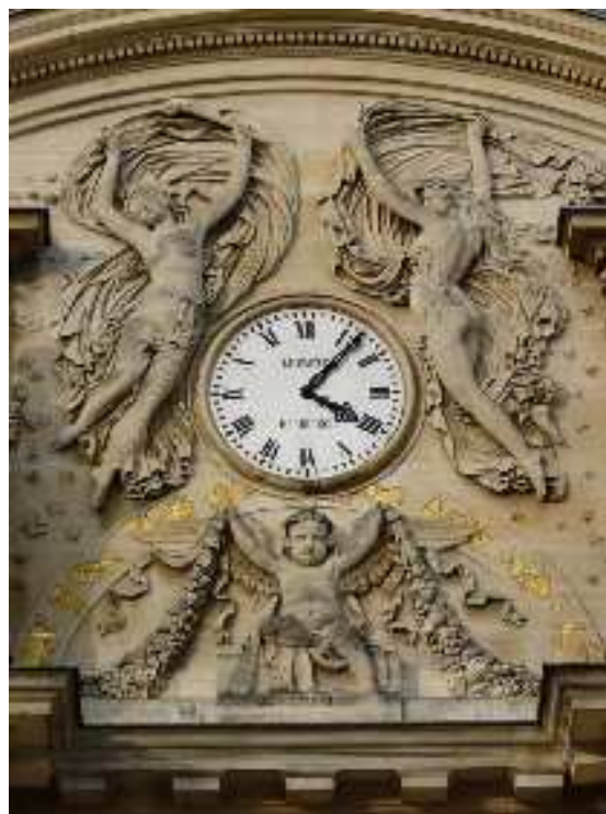
Décoration de l'horloge du palais du Luxembourg

programme allégorique entourant l'horloge. Pradier représente la Nuit par une figure féminine qui tourne le dos au spectateur. L'autre figure féminine, le Jour , est vue de face. Le charme de ces deux silhouettes, enroulées dans des draperies qui flottent, provient de leurs lignes en arabesque proches du travail de Jean Goujon. Admiratif, le sculpteur David d'Angers, pourtant ennemi juré de Pradier, dit à leur propos: « [...] Pradier est certainement l'homme le plus doué pour les arts qu'il est possible de rencontrer ».