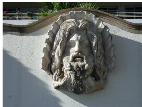
Le mascarón du prieuré de Lamalgue.

Pradier exécute aussi des fresques (un Pallas , La Poésie , une Amphitrite ) et des reliefs dont un, sur le thème de la Maison de Socrate . Mais ces œuvres sont en partie perdues.