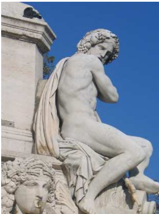
Le Gardon Fontaine Pradier, Nîmes.

Jupiter assis représente le Rhône (« Rhodanus ») un bras posé sur un aviron tandis que l'autre repose sur un masque de la Tragédie, en signe du caractère imprévisible du fleuve.