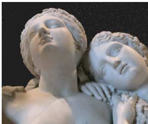
Les Trois Grâces (détail), Musée du Louvre, photo JPM.

La Femme couchée rappelle Le Nu couché de 1907 de Matisse.