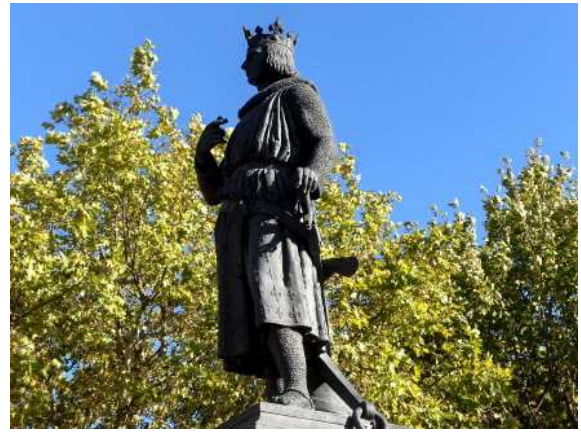
Saint-Louis , Aigues-Mortes.

Pour la ville d'Aigues-Mortes, il exécute en 1847-1848 la statue colossale en bronze de Saint Louis , d'abord attribuée à son rival de longue date Marochetti qui, trop cher, est évincé au profit de Pradier, et ceci grâce à la médiation du nîmois Canonge.