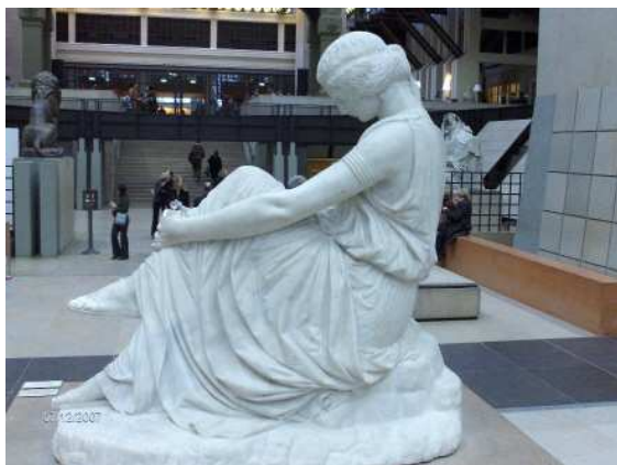
Sappho , musée d'Orsay.

Le musée d'Orsay possède Sappho , une des dernières œuvres de Pradier, décédé au moment de son exposition au Salon de 1852.