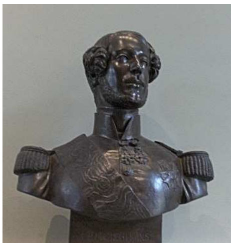
Le duc d'Orléans (1810 – 1842) Exécuté en 1842 d'après le masque funéraire. Musée du Louvre.

Le mécénat n'étant plus dans les mains des grandes familles aristocratiques dont la fortune a été écornée par la Révolution, les artistes doivent se retourner vers l'État et les grandes villes. Pradier s'y emploie sous la Restauration et surtout sous la Monarchie de Juillet.