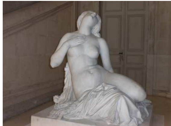
Cassandra , Musée d'Avignon.

À côté des bacchantes, les figures de la mythologie sont pour Pradier un sujet de prédilection . Sans en faire un commentaire exhaustif, nous choisirons les plus caractéristiques du souci de Pradier d'arriver à une représentation parfaite de la beauté, le titre de l'œuvre n'étant alors qu'un prétexte.