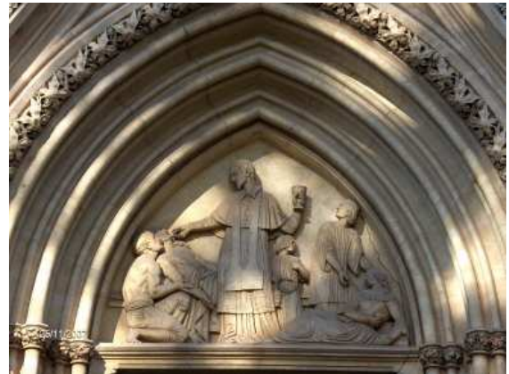
Tympan de la chapelle de La Garde : Saint Charles-Borromée soignant les pestiférés de Milan.

Les critiques reprocheront à Pradier de ne pas avoir senti le côté mystique de la scène en raison de son éducation protestante, mais elles sont à replacer dans un contexte religieux qui n'est plus de mise actuellement. Cette œuvre de Pradier est importante pour la statuaire religieuse française, traduisant la préoccupation de certains chrétiens désireux de donner au Christ l'apparence « du plus beau des hommes » et de trouver une vraie Mère de douleurs laissant tomber ses larmes. La signature de Pradier est visible sur le côté gauche du bas de la robe de la Vierge.