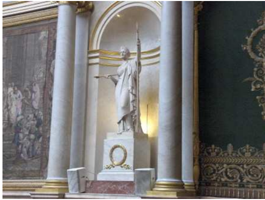
L'ordre public, Chambre des députés.

Coiffée d'une peau de panthère, La Liberté foule aux pieds des chaînes et un joug rompus. Elle tient de la main droite le drapeau tricolore, surmonté du coq. L'hirondelle, initialement prévue pour la main gauche, a été remplacée par une Victoire, commémorant les Trois Glorieuses, à l'instar de l'inscription figurant sur le socle disposé au pied de la statue.